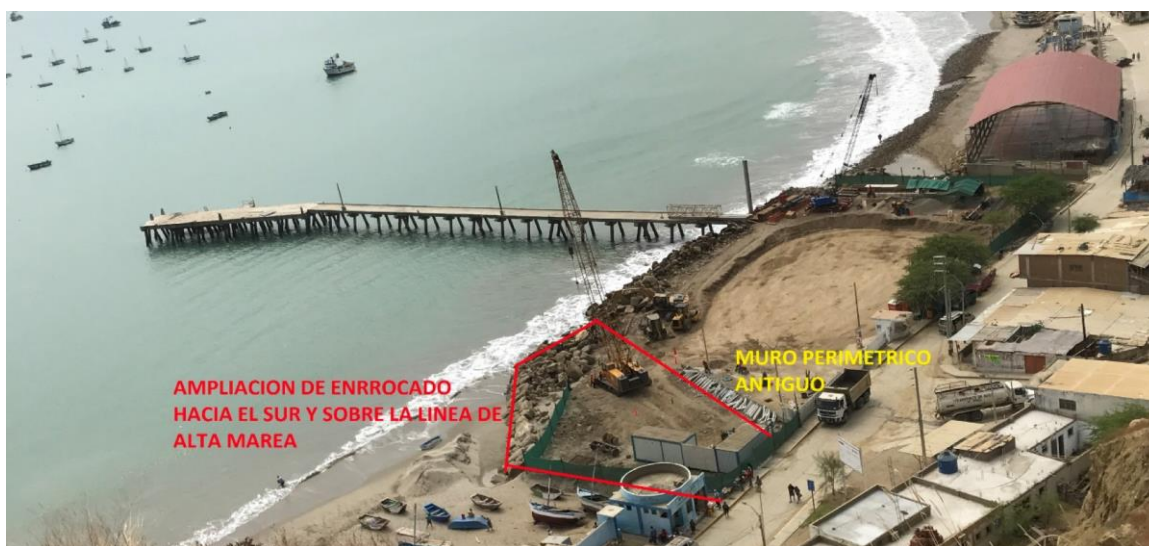
Imagen 7. El perímetro marcado en rojo muestra la ampliación del enrocado hacia el sur, lo que genera una amenaza contra la ola.

Lamentablemente, FONDEPES no viene cumpliendo con sus acuerdos hasta la fecha. La empresa PSV, quien ganó la licitación en el mes de junio amplió el enrocado hacia el mar y hacia la playa, y según declaraciones de su personal, no ha recibido un nuevo diseño formal por parte de FONDEPES. Es decir, la empresa PSV aun tiene el compromiso de construir el muelle en Z. Asimismo, en el caso de los pilotes, se mantiene la idea de construir pilotes transversales, que significarían una trampa mortal para los tablistas y los veraneantes, poniendo en mayor riesgo la integridad y la vida de ciudadanos. Según los expertos en la materia, opinión que ha sido avalada por los ingenieros de PSV, de construirse los pilotes con acero, se podría tener mayor distancia entre los mismos, sin que ello genere un mayor costo. La FENTA ha solicitado formalmente una reunión con FONDEPES y la empresa el 18 del presente para tocar estos temas y hallar una solución que no ponga en riesgo a la ola y tampoco genere una demora en la construcción del muelle, dado que los pescadores necesitan contar con un muelle adecuado para realizar sus faenas.