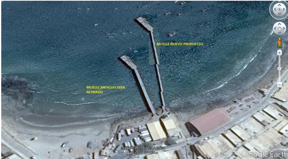
Imagen 4. Diseño del muelle avalado por FENTA y Gremio de Pescadores Artesanales de Cabo Blanco.