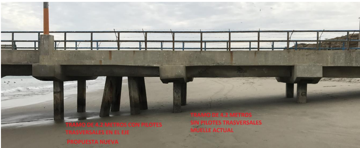
Imagen 9 : Diferencia entre tramo libre de 4.2 metros y tramo con pilotes trasversales en el eje (propuesta nueva FONDEPES)

De no contar con una respuesta inmediata por parte de FONDEPES, con la cual se garantice que los siguientes acuerdos serán cumplidos: i) Retiro de las rocas que han ampliado el enrocado actual en la zona adyacente de la ola protegida; y, ii) Envío de una