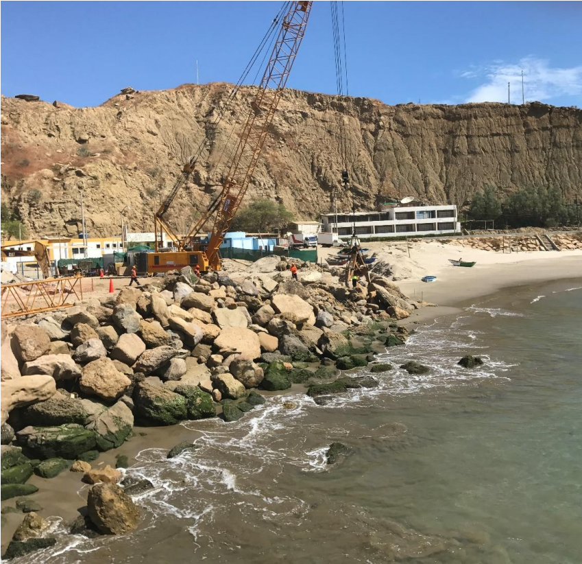
Imagen 8: Maquinaria trabajando en ampliación del enrocado sobre la línea de alta marea dentro de la zona intangible de la rompiente