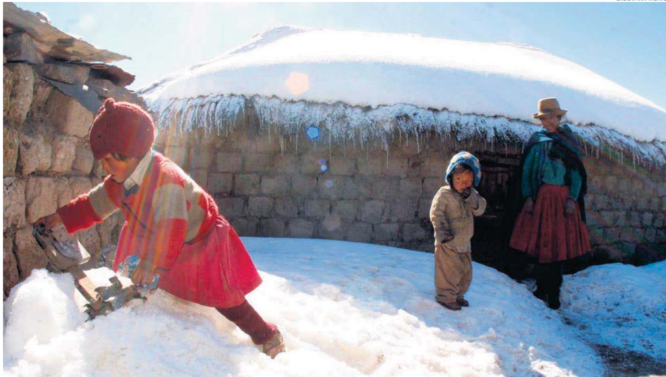
CIFRAS FRÍAS. En lo que va del año, ya han fallecido 91 personas por neumonía. Cusco es la región con más defunciones. Le siguen Loreto, Puno, Huancavelica y La Libertad.

El funcionario agregó que la elección de los distritos se hizo de acuerdo con el "rango de