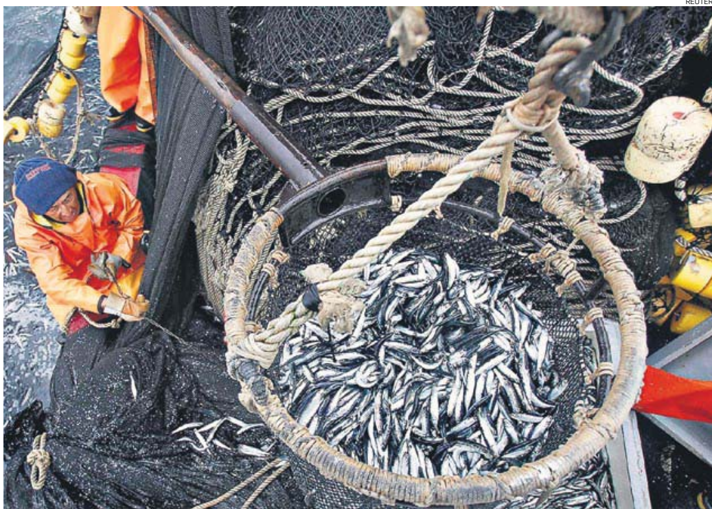
CAPTURAS. Solo queda 37% de la cuota de anchoveta, que deberá completarse hacia fines de junio.