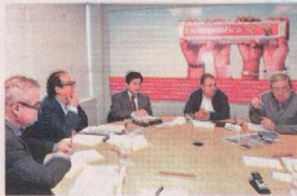
MESA REDONDA. Debate sobre minería y medio ambiente.

"Hay un tema estructural que si hay que reconocer, que tiene que ver con cómo se gastan los recursos que producen las industrias extractivas. Hay mucho dinero en las regiones que no se gastan adecuadamente. La que le toca al Ejecutivo tiene que ver con entrenar a esos gobiernos locales para que estén preparados en gestionar sus recursos", manifestó el viceministro de Minas.