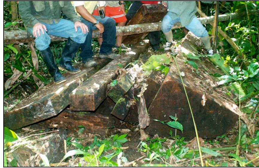
Foto C: Tablones de caoba abandonados en las cabeceras del río Yurúa