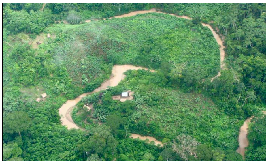
Foto A: Asentamiento maderero en las cabeceras del río Mapuya, dentro de la Reserva Murunahua y cerca del límite con el Parque Nacional Alto Purús

En las cabeceras del río Mapuya, dentro de la Reserva Murunahua, se ha ubicado una gran operación de tala ilegal de madera, cerca del límite con el Parque Nacional Alto Purús (ver Foto A). Esta base ilegal fue descubierta por UAC en marzo de 2009. Durante un sobrevuelo en abril de ese año, se observó dos balsas de tablones de caoba recientemente talados, lo que indica que el campamento continua siendo usado como un centro de transporte de caoba ilegal obtenida de la Reserva y del Parque.