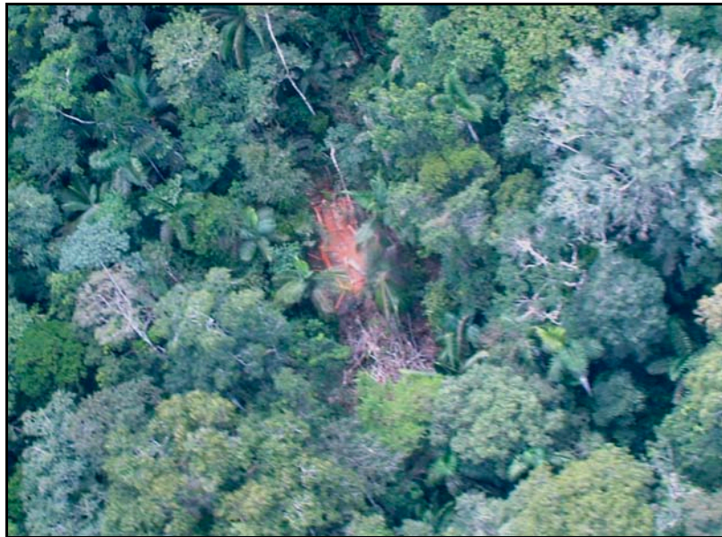
Foto D: Árbol de caoba recientemente talado en cabeceras del Yurúa