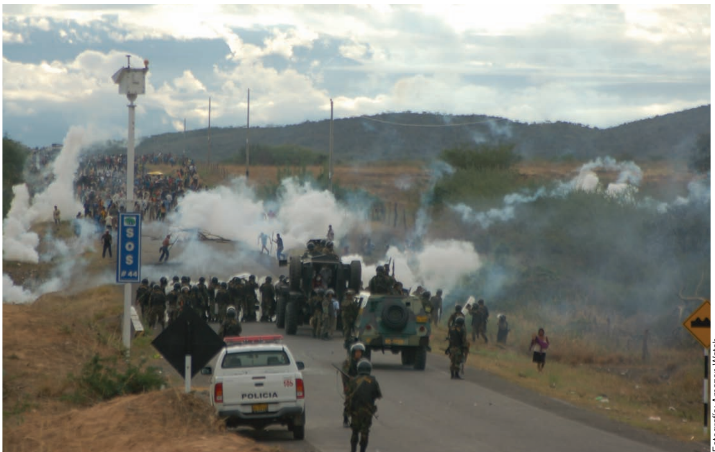
Operativo fallido. El 5 de junio, la Policía llegó a la carretera Fernando Belaunde con la intención de desalojar a los protestantes. Pero esta acción tuvo una pésima organización.