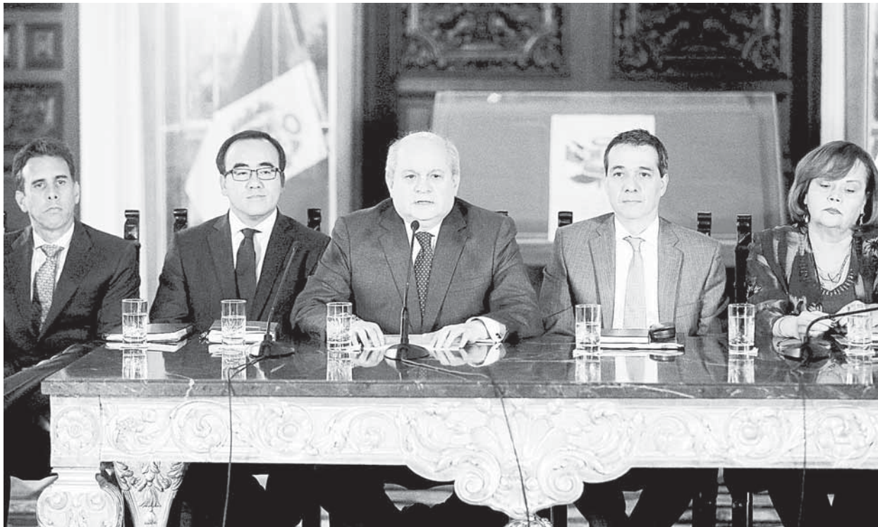
Conferencia. Las facultades permitirán al Gobierno destrabar una serie de inversiones de proyectos importantes, dijo Cateriano.

“La economía es un tema absolutamente sensible y para