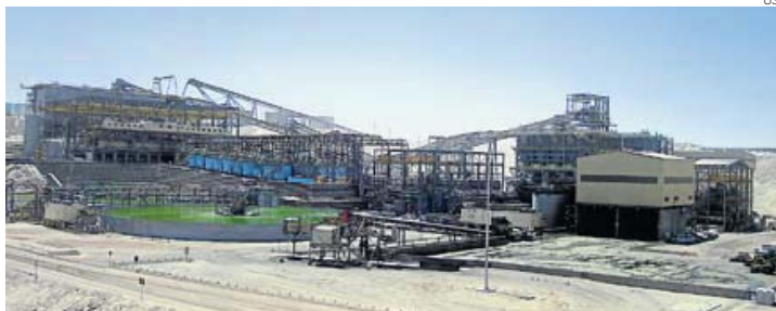
En positivo. Ampliación de Cerro Verde culminará entre fines de este año y principios del 2016.