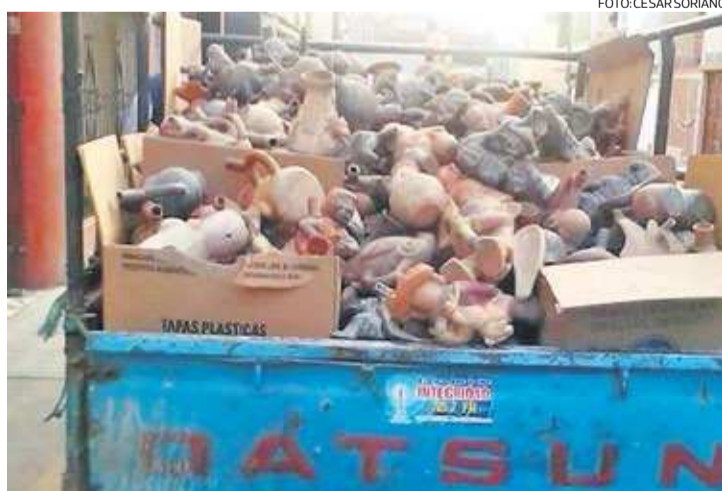
EVIDENCIA. Las piezas arqueológicas fueron trasladadas en una camioneta. El caso será investigado por el Ministerio de Cultura.

zas arqueológicas pertenecen a las culturas Moche y Chimú.