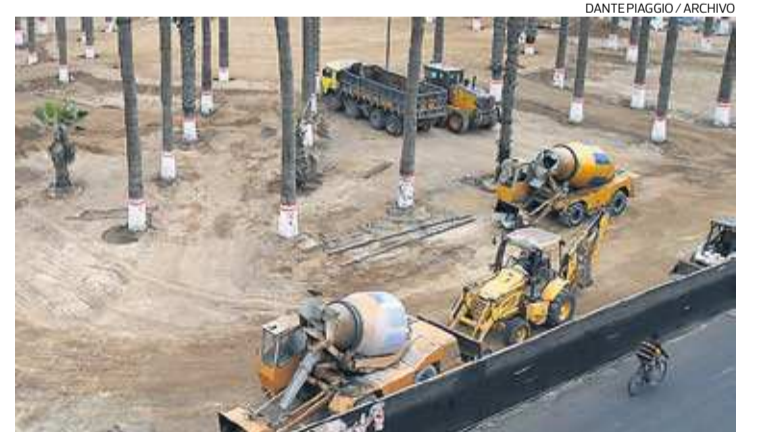
EN ALERTA. Los vehículos pesados afectan la plaza de Chincha, que hace seis meses fue declarada Patrimonio Cultural de la Nación.

“Espero que se haga una investigación para así poder dar con estas mafias”, dijo.